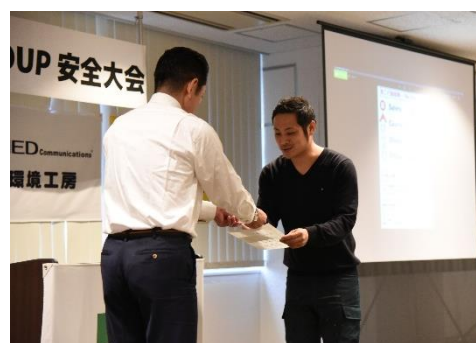
安全大会で行われた表彰の様子

さらに当社では、喫煙者0の取り組みを社員だけでなく、当社と関わるパートナー企業へも広げ建設業界全体のイメージアップにつなげるための活動に力を入れています。毎年2回行われる安全大会では喫煙者0の取り組みに力を入れているパートナー企業の表彰などを通して、喫煙者0の取り組みへの理解を深める活動も行っています。